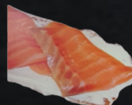
SALMÓN Y PHILADELPHIA