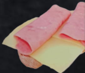
YORK Y QUESO