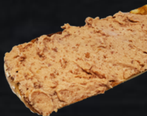
CREMA DE YORK