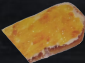
MANTEQUILLA Y MERMELADA (melocotón, fresa)