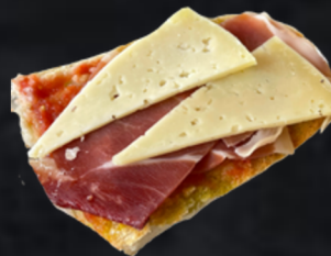
JAMÓN Y QUESO