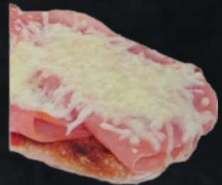
YORK Y QUESO